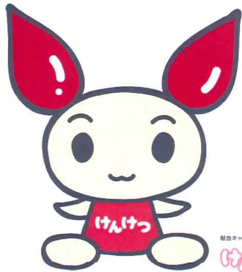
献血キャラクター けんけつちゃん